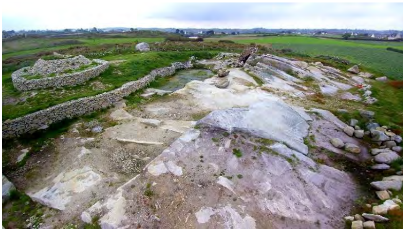
Carrière de Kerfiat, Cléder

🌀 Les 18 et 19 septembre , le Réseau pierre sèche Finistère propose des animations autour de la carrière de Kerfiat de Cléder. Initiation à la maçonnerie sèche, visite guidée de la carrière et du littoral, visite de l'exposition de la Fédération Française des Professionnels de la Pierres sèches (installée du 17 septembre au 15 octobre)... Ces animations font partie des « Coups de cœur » Journées Européennes du Patrimoine, de la Région Bretagne.