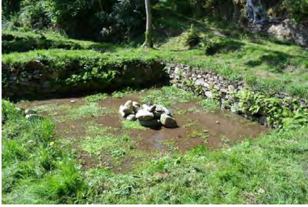
Routoirs de Horc'hant ou Gwazh an Orc'hant (Trédarzec) : bassin n°4

🌀 L'école des talus n'est pas en reste puisque leur animation a également été retenue parmi les Coups de cœur Région. Le 18 septembre sur le site de Gwazh an Orc'hant à Trédarzec , aura lieu des démonstrations de savoir-faire murailles puis une randonnée-visite. Vous pourrez découvrir les routoirs restaurés par l'association : http://patrimoine.region-bretagne.fr/gertrude-diffusion/dossier/routoirs-de-horc-hant-ou-gwazh-an-orc-hant-tredarzec/c977359-4a3c-40ba-8773-52008116c6de