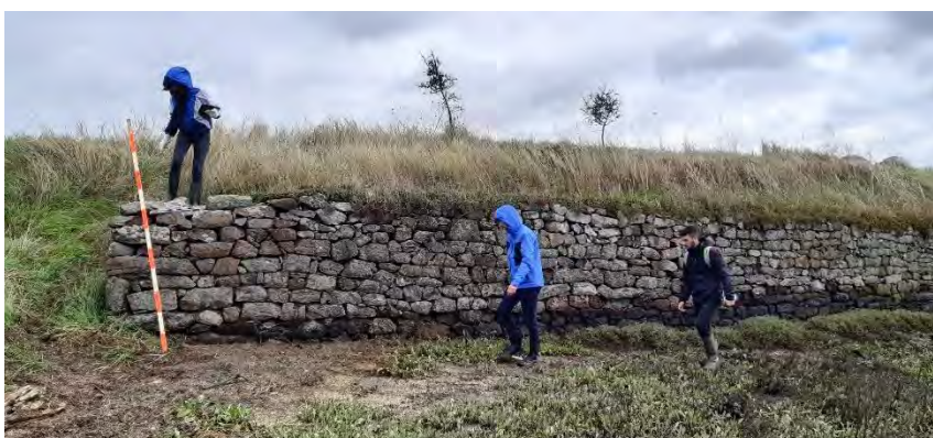
Opération de recensement des perrés de Rance

Les maçonneries des rives de la Rance, inventoriées en 2019-2020 par les étudiants du Master REPAT de l'Université Rennes 2, représentent un corpus important d'ouvrages. Il s'agit principalement de perrés qui protègent et soutiennent les berges. La validation des notices de recensement est en cours et un dossier d'étude accessible sur le portail de la Région sera publié durant l'été.