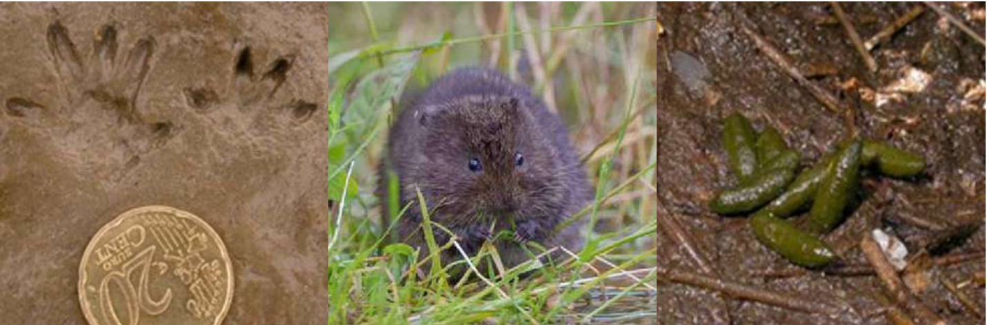
Campagnol amphibie et ses indices de présence

On peut y découvrir le Campagnol amphibie , espèce protégée, répartie uniquement dans l'ouest de l'Europe et plus abondante dans l'ouest de la Bretagne. Cette espèce très discrète laisse des indices que vous pouvez rechercher aux abords des lavoirs : empreintes, fèces et traces de repas.