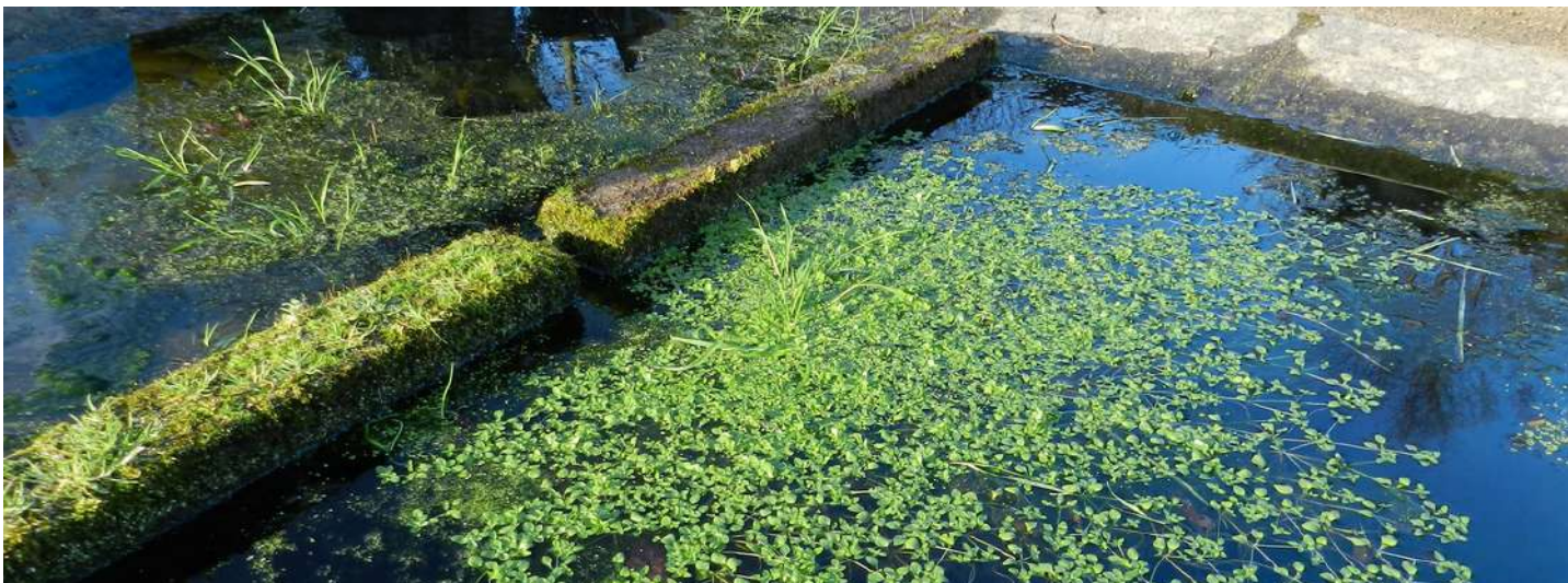
Extension en surface de la callitriche au mois de janvier

À la surface, il est possible d'observer des callitriches qui se multiplient par graine et dont les plantules apparaissent en hiver au fond des bassins. Leurs feuilles, assez petites, se distinguent de celles des lentilles d'eau par leur plus grande taille et parce qu'elles sont disposées en rosettes et reliées par de fines tiges. Les callitriches forment un voile de couverture mélangé à d'autres espèces ou bien elles peuvent constituer un coussin très dense.