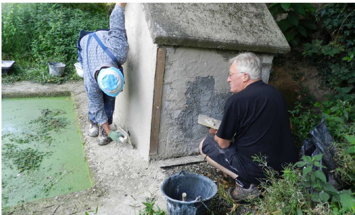
Recours à un mortier sable - chaux à l'extérieur du lavoir