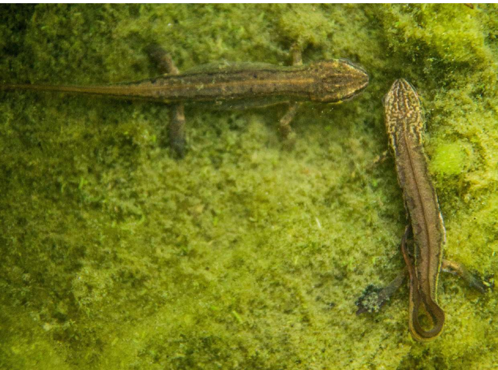
Tritons palmés dans les algues filamenteuses

Si des actions de prélèvement doivent néanmoins être menées sur les algues filamenteuses et les lentilles d'eau, celles-ci doivent être inspectées méthodiquement par un tri minutieux. En effet, déposer ces végétaux sur la berge du lavoir dans l'espoir que les animaux s'en échappent et regagnent le lavoir est illusoire. Hors de l'eau, ces tas constituent des pièges dont aucune larve ne peut s'extraire.