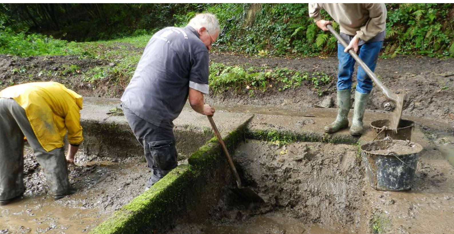
Curage de la boue de ravinement

Enfin, ces sédiments organiques ne doivent pas former une couche épaisse dégageant une odeur désagréable quand elle est remuée, indice d'absence d'oxygène, due à une accumulation trop importante de matières organiques. Cette situation exceptionnelle peut justifier un curage du lavoir. Elle se manifeste en particulier dans le cas d'un débit de source insuffisant pour oxygéner le lavoir, ralentissant ainsi la minéralisation.