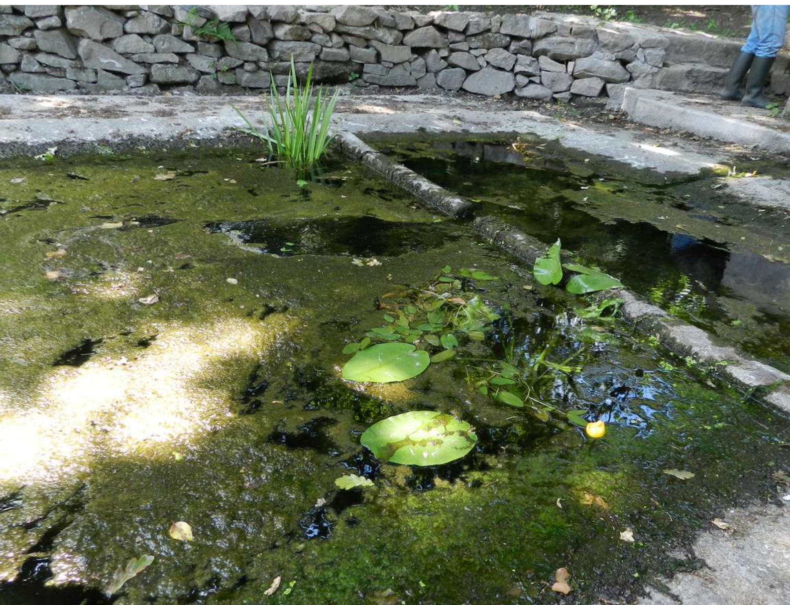
Nénuphar jaune et Rubanier dressé introduits dans le lavoir

Cette méthode est, par ailleurs, réservée aux lavoirs suffisamment profonds qui ne s'assèchent pas à l'étiage.