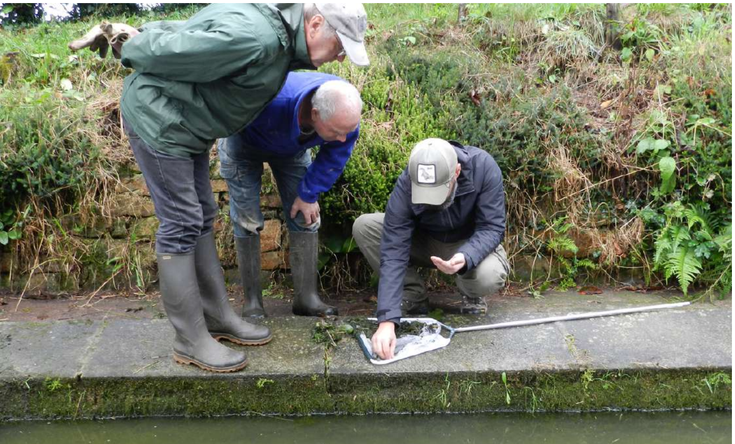
Pêche au filet avant vidange