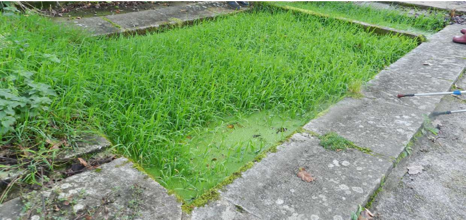
Agrostis stolonifère colonisant un bassin en novembre

Parmi les végétaux aquatiques il peut apparaître pendant l'été quelques feuilles disséminées de l' Agrostis stolonifère qui peut à son tour se densifier et supplanter partiellement les callitriches.