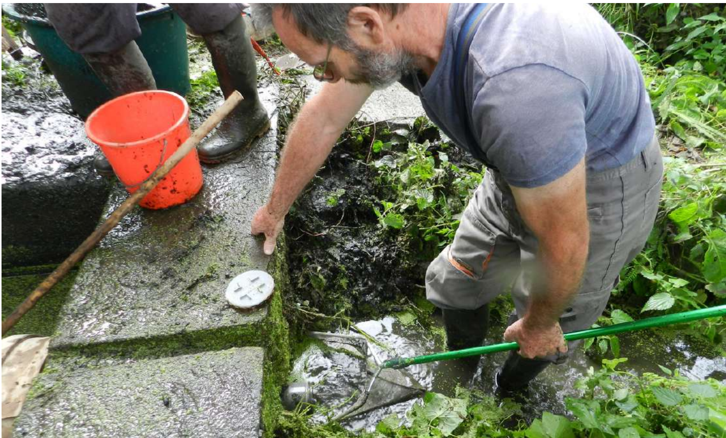
Filtration de la vidange